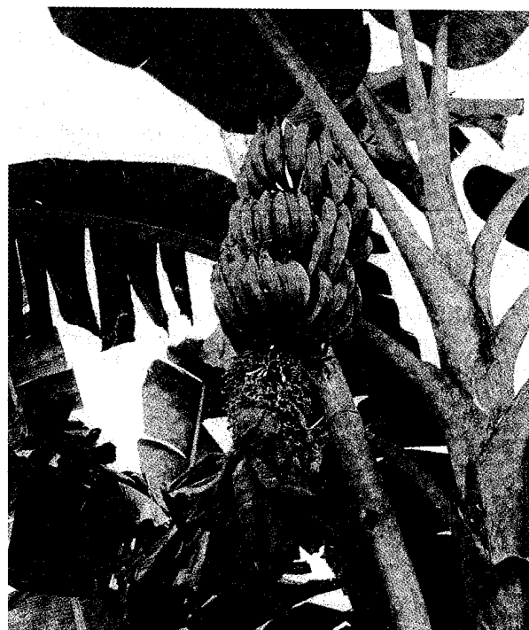
Photo 3. Variété French sombre.

Comme cela a déjà été signalé, les régions du sud-est, du centre-ouest et du sud-ouest de la Côte-d'Ivoire, qui bénéficient d'une pluviométrie abondante et bien étalée dans l'année, sont favorables à ce type de production de contre-saison.