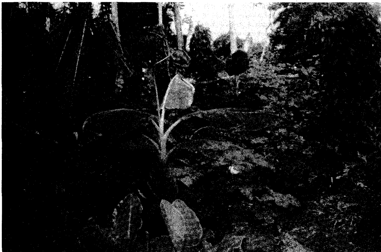
Photo 4. Culture associée de plantain et de vivriers (gombo, igname, taro).

L'étude des dates de plantation, conduite en station d'expérimentation (à Azaguié, au sud-est de la Côte-d'Ivoire), a permis de définir certaines périodes de plantation plus particulièrement favorables à une production de contre-saison. Celles-ci peuvent s'étaler de juillet à octobre : le rendement observé à la récolte, au mois d'octobre suivant, peut atteindre de 32,5 t / ha (N'GUESSAN, 1991 et 1992).