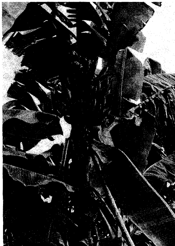
Photo 1. Variété Corne 1.

En Côte-d'Ivoire la variété Corne 1 (photo 1) est dominante en milieu paysan. Ses rendements moyens de 10 à 15 t/ha en cultures villageoises, ou de 25 à 30 t/ha en station expérimentale, sont relativement faibles. Des espèces plus productives, et également appréciées des consommateurs, devront être développées au niveau national, en s'appuyant sur les résultats de la recherche.